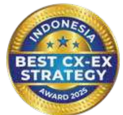
Indonesia Best CX-EX Strategy Award by SWA