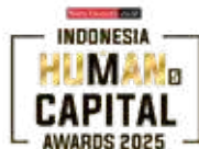
Indonesia Human Capital Awards by Warta Ekonomi