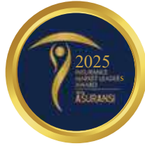
Insurance Market Leaders Award by Media Asuransi