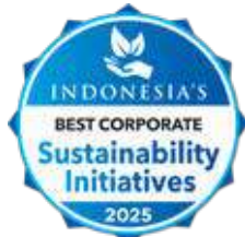
Indonesia's Best Corporate Sustainability Initiatives by MIX