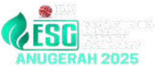
Anugerah ESG by IDX Channel