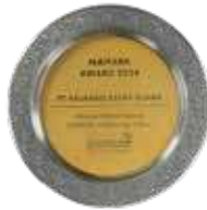
Maipark Award by Maipark Reasuransi Indonesia