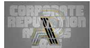
Corporate Reputation Awards by Iconomics