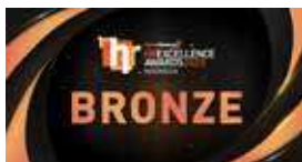
HR Excellence Awards by Human Resource