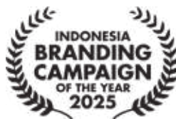
Indonesia Branding Campaign of the Year by Marketeers