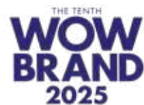
WOW Brand Award by Marketeers